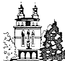
St. Laurentius Heiligenwald