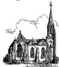
St. Martin Schiffweiler