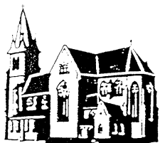
Herz Jesu Landsweiler-Reden