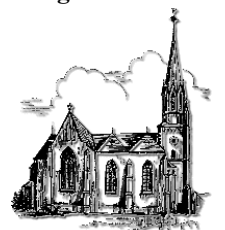
St. Martin Schiffweiler

Servatiusbasilika Maastricht