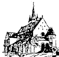
St. Barbara Stennweiler

Taufe des Herrn, 2. und 3. Sonntag im Jahreskreis