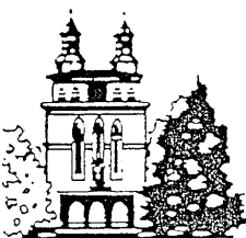
St. Laurentius Heiligenwald